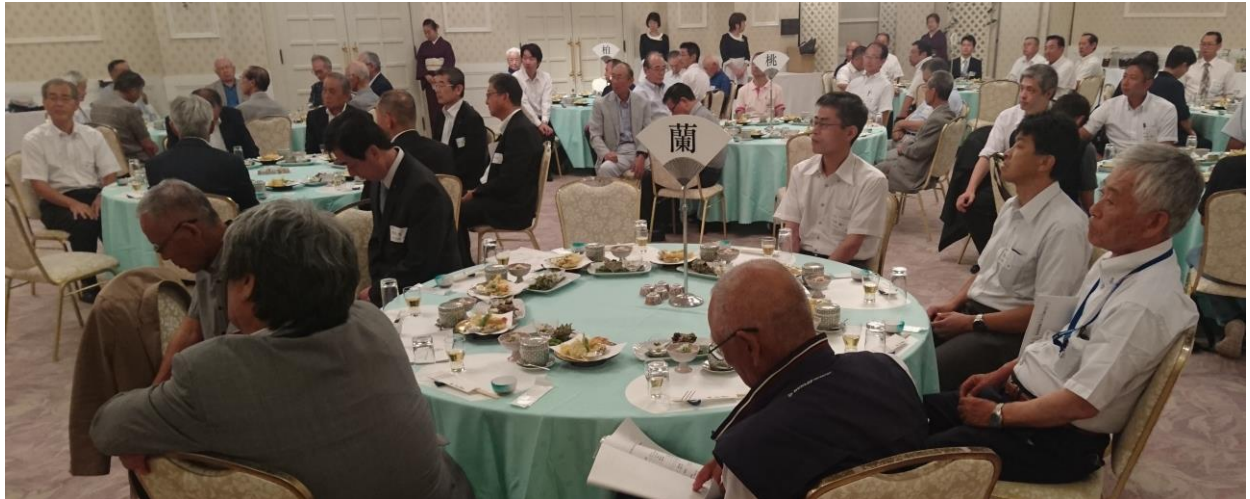
すべてがうまくいくことを祈念して乾杯