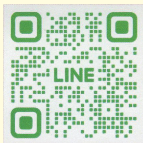
友だち追加の QR コード